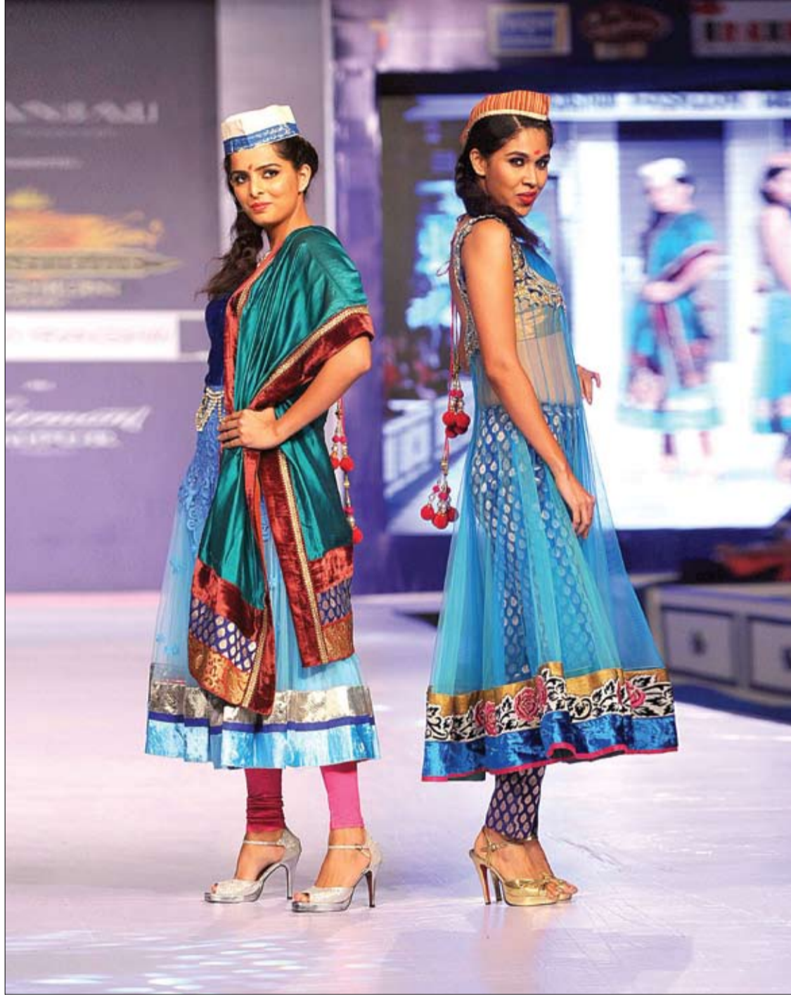
عارضتان تقدمان أزياء من تصميم شاراد راغاف خلال عرض للأزياء في أسبوع الموضة في ولاية راجاستان الهندية.